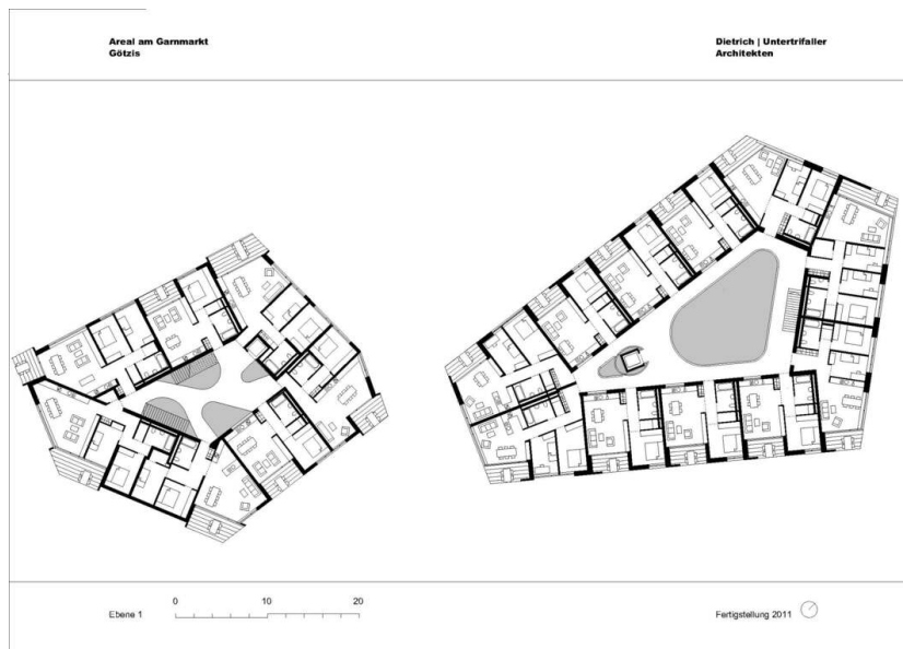
Am Garnmarkt 10+20