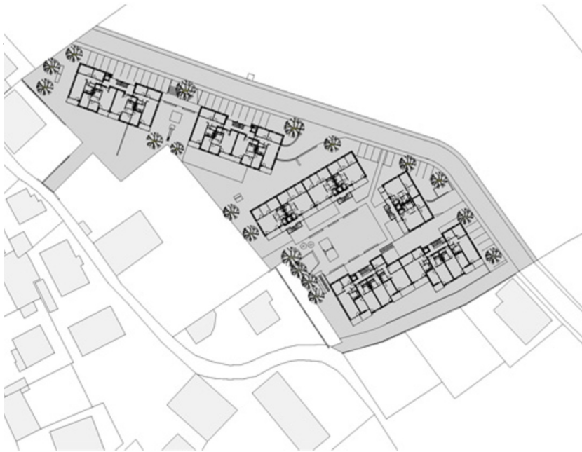
Wohnanlage Niedermühlbichler Gründe