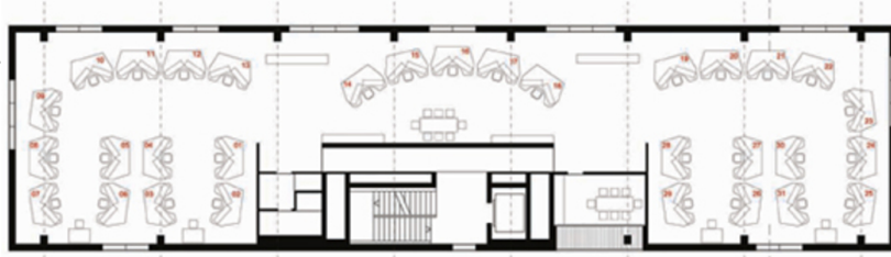
3. OBERGESCHOSS - PRODUKTION