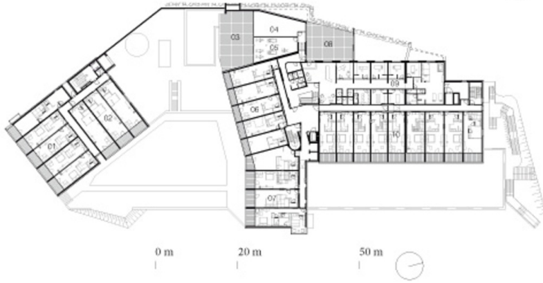
Grundriss EG OG2