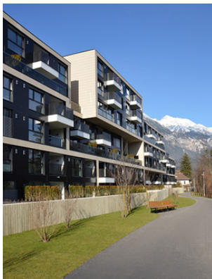
© Robert Wibmer - obermoser arch-omo zt gmbh