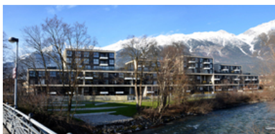
© Robert Wibmer - obermoser arch-omo zt gmbh

Durch die kompakte Anordnung der Bebauung wurden große zusammenhängende Grünflächen möglich und der Inselcharakter erhalten. Die geforderten öffentlichen Freiräume liegen im Osten entlang der Sill, wo eine sich verbreiternde Promenade