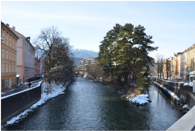
© Robert Wibmer - obermoser arch-omo zt gmbh