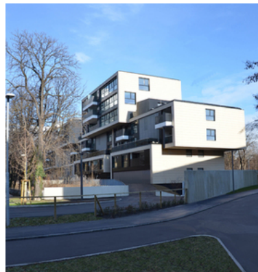
© Robert Wibmer - obermoser arch-omo zt gmbh