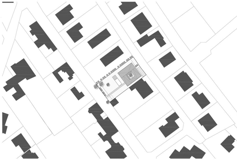
Haus in Bisamberg