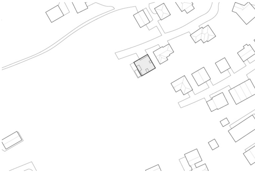
Haus im Trattnachtal