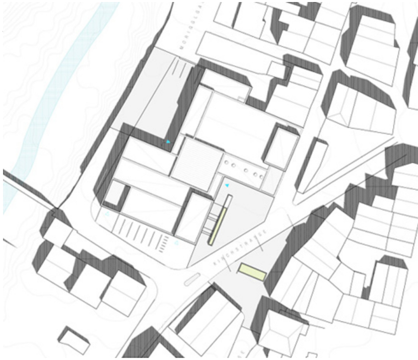
Kultur- und Veranstaltungszentrum B4