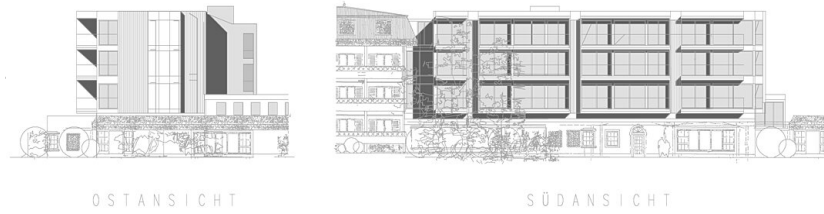
Ostansicht u. Südansicht des Neubaues