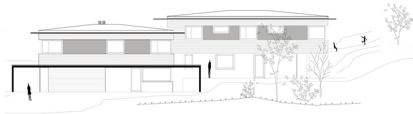
Haus Simonit: Ansicht Süd