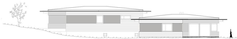
Haus Simonit: Ansicht Nord