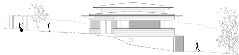
Haus Simonit: Ansicht West