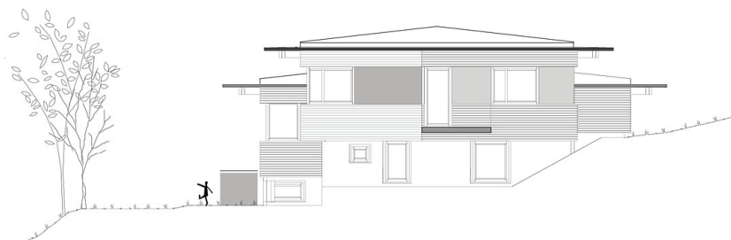
Haus Simonit: Ansicht Ost