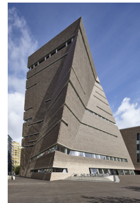
© Andy Stagg / ARTUR IMAGES