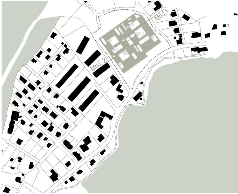
Kinderbetreuungseinrichtung KAGES & Medizinische Universität Graz (MUG)