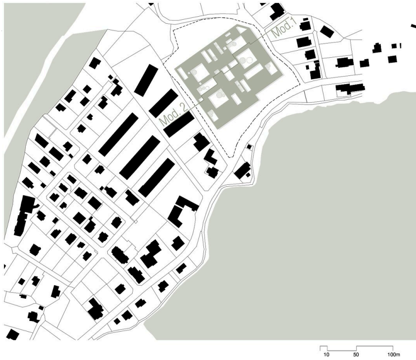
Kinderbetreuungseinrichtung KAGES & Medizinische Universität Graz (MUG)