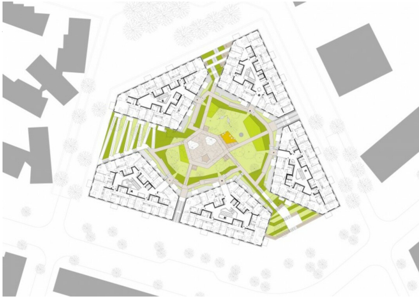
WAS - Wohn- und Geschäftsareal Seestadt Aspern