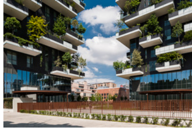
© Iñigo Bujedo-Aguirre / ARTUR IMAGES