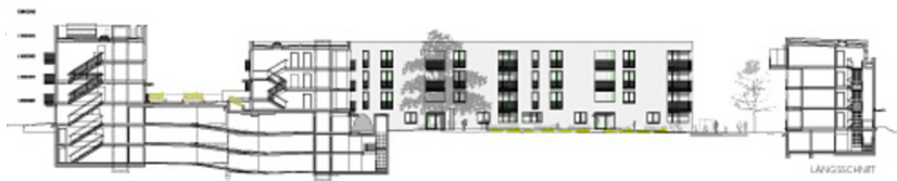
Wohnbau Pradl Ost – 1. Bauabschnitt