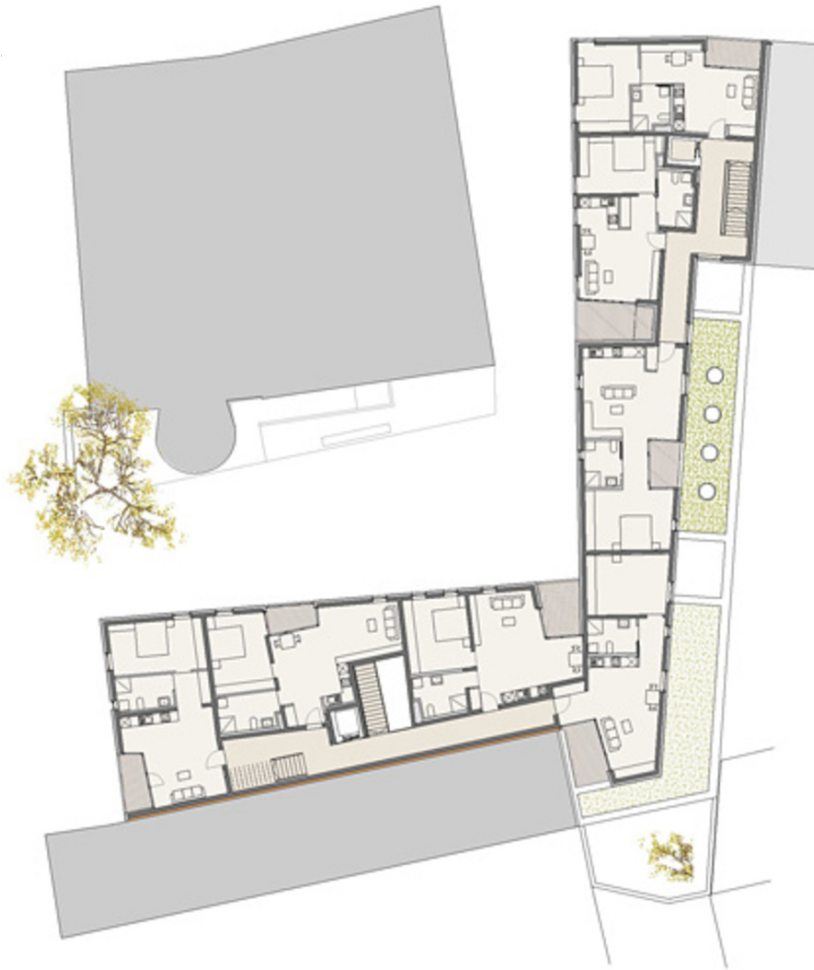
Seniorenwohnanlage mit Stadtteilzentrum Wilten