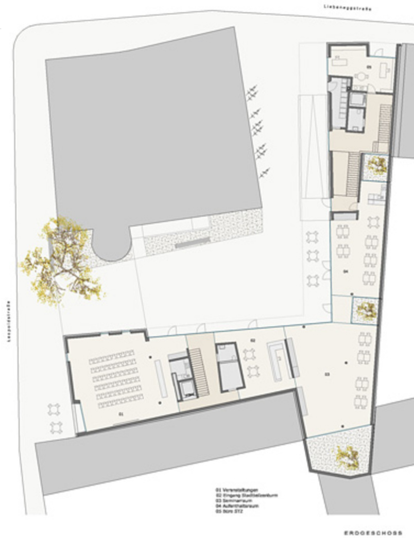
Seniorenwohnanlage mit Stadtteilzentrum Wilten