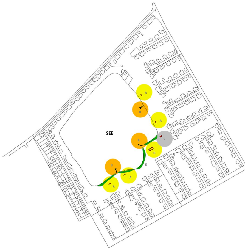
Esterhazy'sche Feriensiedlung - Lageplan