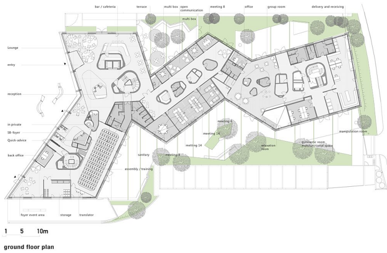
Innenarchitektur Grundriss EG