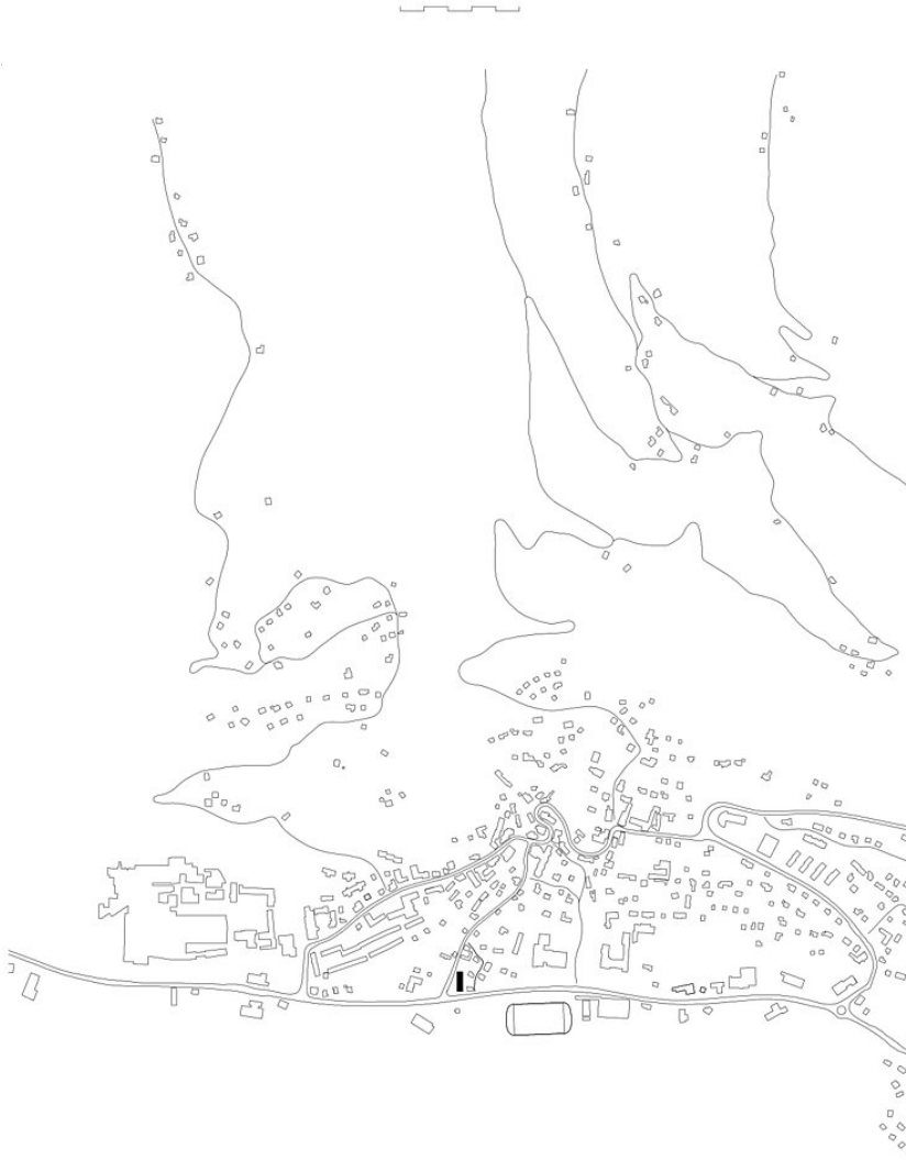
15-02 - SCHAUKÄSEREI KASLAB'N - SCHWARZPLAN