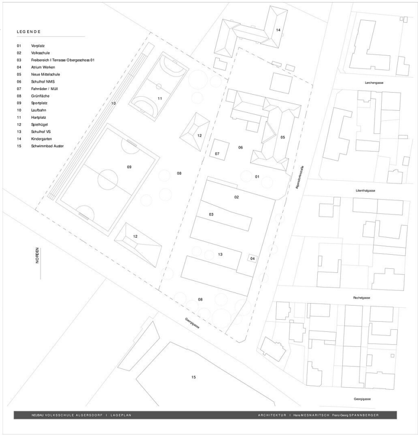
ALGERSDORF LAGEPLAN 01