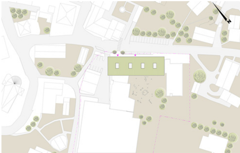
Erweiterung Kindergarten Kundl