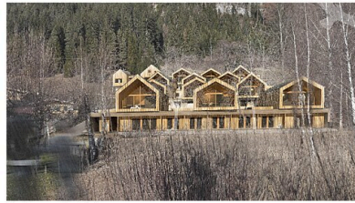
Visualisierung zur Einreichplanung