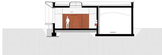
SCHNITT - Q