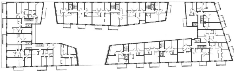
Grundriss Ebene 2