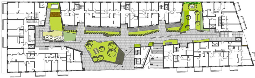
Grundriss Ebene 1