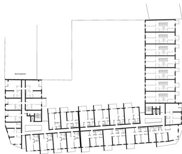
1. Obergeschoss 1. floor

JWA JOSEF WEICHENBERGER ARCHITECTS + PARTNER | 1010 WIEN JOSEF WEICHENBERGER 27 GUMBI | SCHÖNBRUNNER STRASSE 15 6111 9 | A-1010 WIEN | 1010 OFFICE @ WEICHENBERGER.AT | 1010 HTTP://WWW.WEICHENBERGER.AT