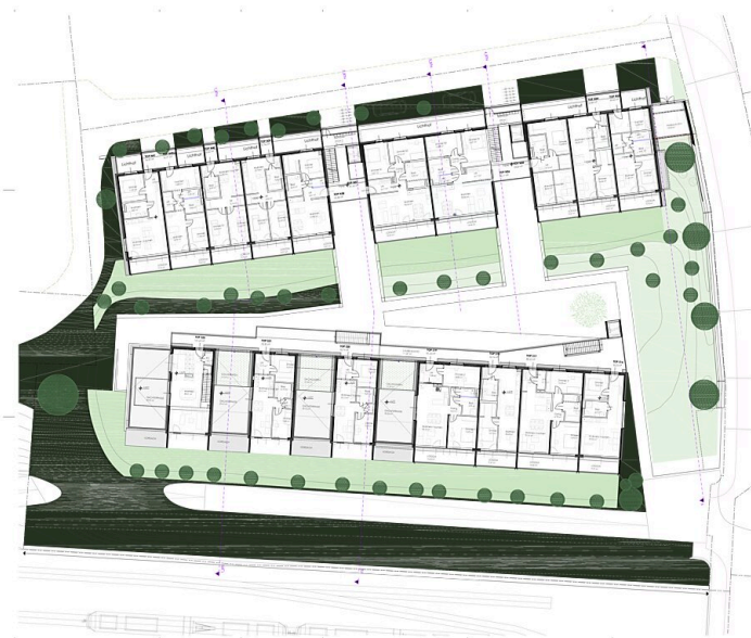
Grundriss E5 - Zugang Bauteil Nord