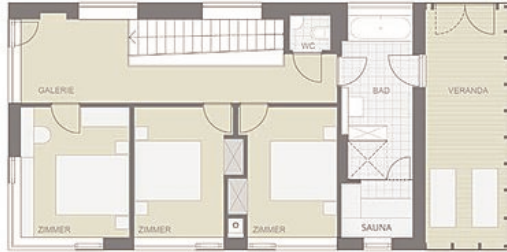
Loft 1 OG