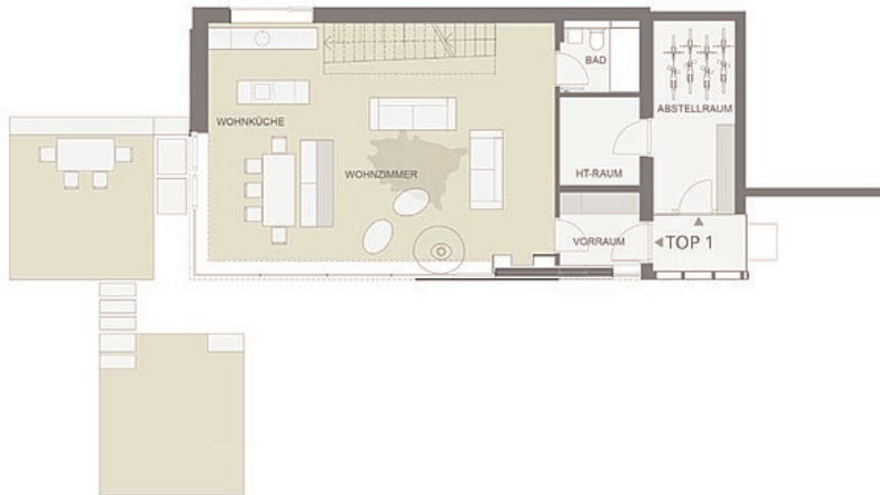
Loft 1 EG