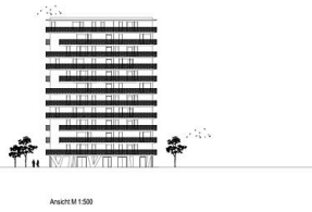
Ansicht M 1.500