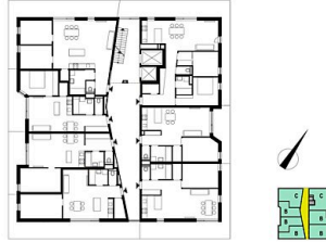
Regelgeschoss M 1.250