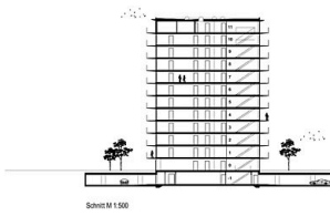
Schnitt M 1.500