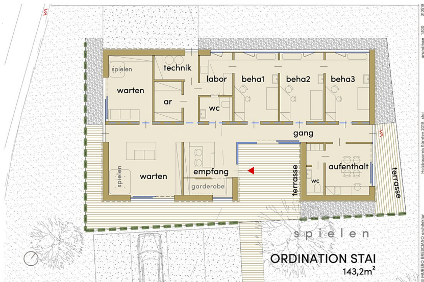
Stai Pub Nextroom