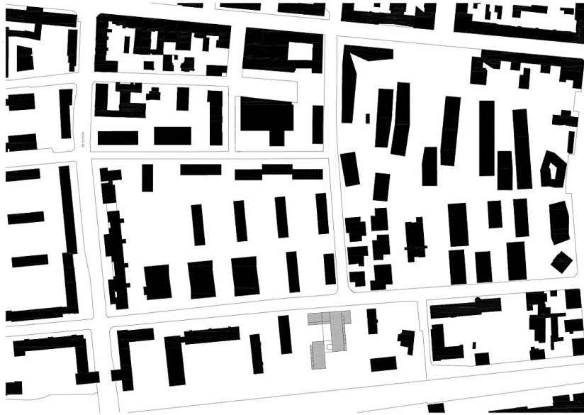
Wohnbebauung Strubergasse - Baufeld I