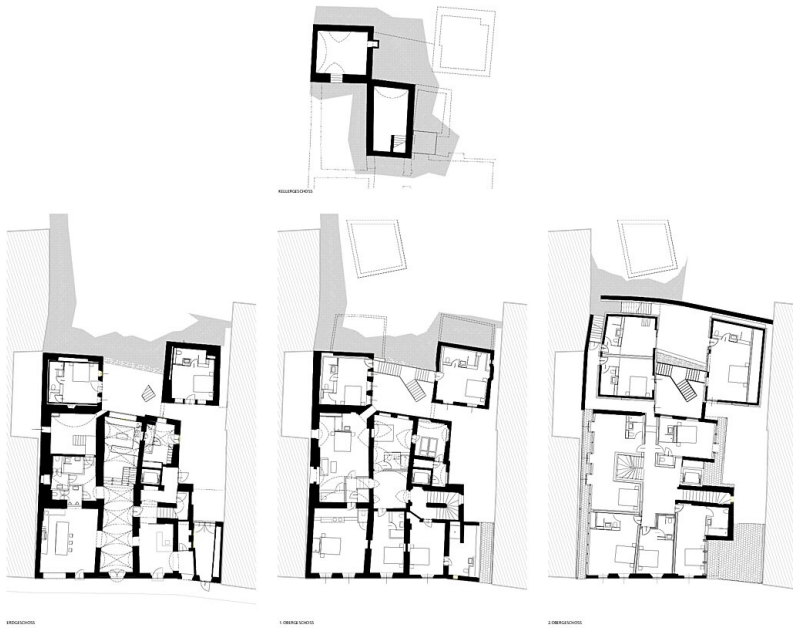
Grundrisse UK, EG, OG1, OG2