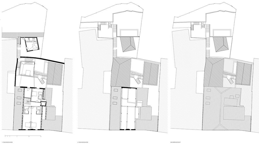
Grundrisse DG1, DG2 & Dachaufsicht