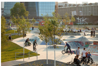
© SINAI Gesellschaft von Landschaftsarchitekten mbH

Der Hafenpark bildet im Frankfurter Osten den Abschluss der Grün- und Flaniermeile des Mainufers und den Anschluss an den Grüngürtel, der als Volkspark des 21. Jahrhunderts gilt. Die Struktur des Parks ist großmaßstäblich gedacht: Ein prägnantes „Sportband“, das Blickbeziehungen zwischen Honsellbrücke und Skyline der Innenstadt sowie zum neuen EZB-Hochhaus schafft. Der „concrete jungle“ an der Eyssenstraße ist mit 5.000 m 2 einer der größten Skateparks Europas und offener Bestandteil des Parks. Die Bepflanzung mit Gräsern und Zürgelbäumen machen ihn Grün. Im „Sportband“ geben Stahltreillagen den Spielfeldern Arena-Atmosphäre, Spiel- und Fitnessbereiche sind vegetativ eingebettet. Zur Mainpromenade hin entstehen auf schollenartigen Wiesenplateaus Ruhezone und natürliche Entwicklungsbereiche. Das Programm für den Hafenpark resultiert aus einer Online-Umfrage der Stadt Frankfurt. (Text: Landschaftsarchitekten, bearbeitet)