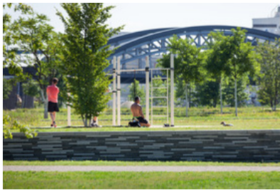
© SINAI Gesellschaft von Landschaftsarchitekten mbH