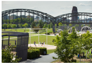
© SINAI Gesellschaft von Landschaftsarchitekten mbH