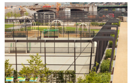
© SINAI Gesellschaft von Landschaftsarchitekten mbH