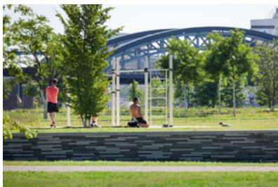
© SINAI Gesellschaft von Landschaftsarchitekten mbH