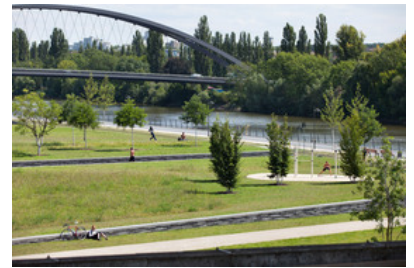
© SINAI Gesellschaft von Landschaftsarchitekten mbH