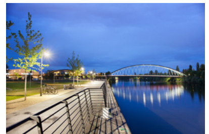
© SINAI Gesellschaft von Landschaftsarchitekten mbH