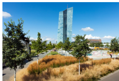
© SINAI Gesellschaft von Landschaftsarchitekten mbH