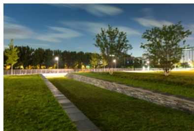
© SINAI Gesellschaft von Landschaftsarchitekten mbH