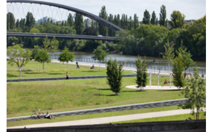
© SINAI Gesellschaft von Landschaftsarchitekten mbH