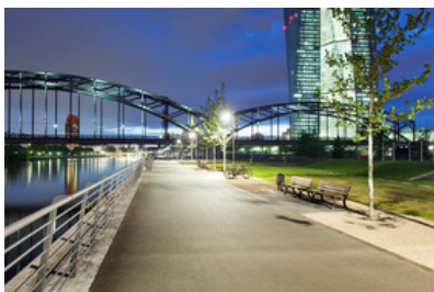
© SINAI Gesellschaft von Landschaftsarchitekten mbH