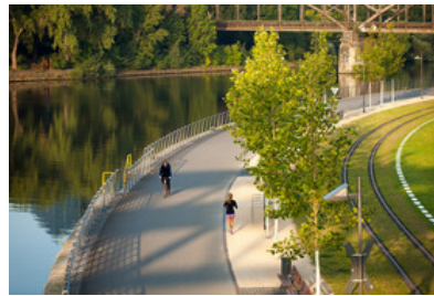
© SINAI Gesellschaft von Landschaftsarchitekten mbH