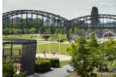
© SINAI Gesellschaft von Landschaftsarchitekten mbH