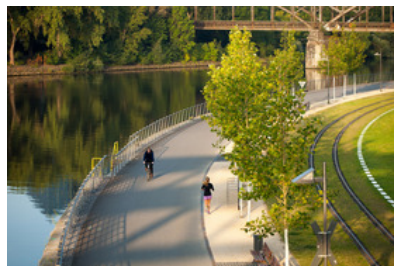
© SINAI Gesellschaft von Landschaftsarchitekten mbH