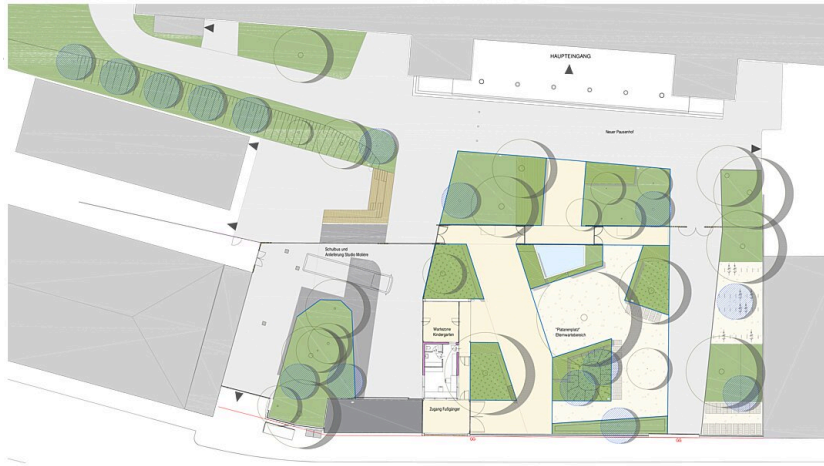
Freiraum Lycée Français de Vienne