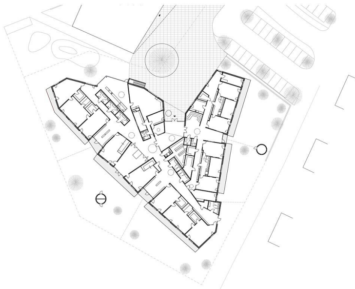
Kibe Neumarkt EG