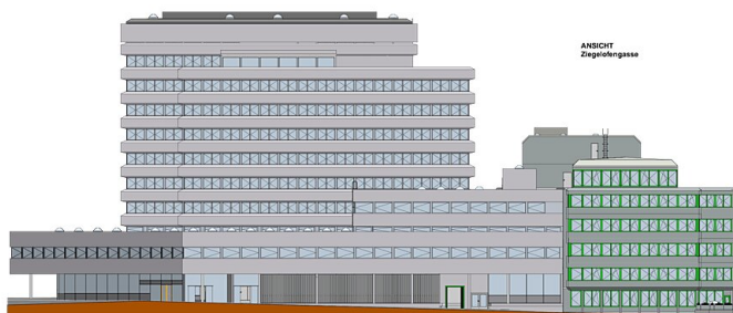
Ansicht Ziegelofenstraße Bestand