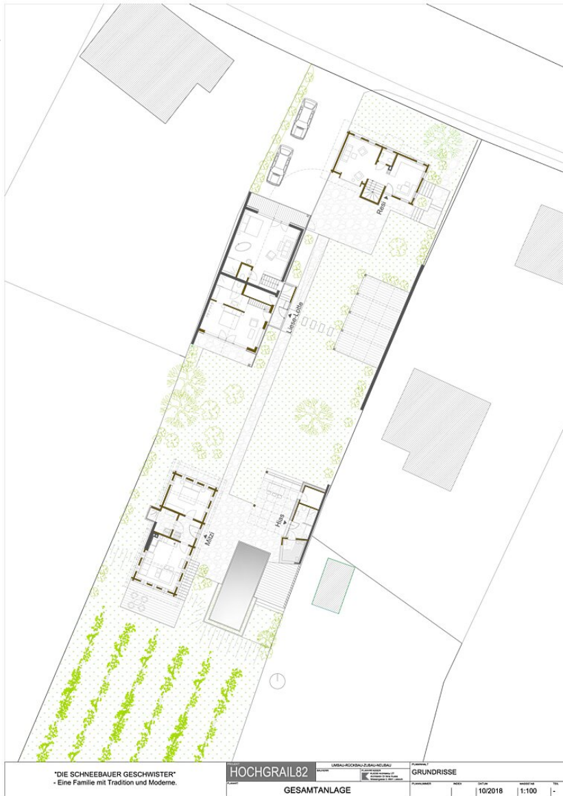
Lageplan, Grundriss EG