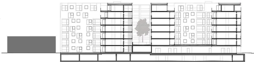
Schnitt + Ansicht