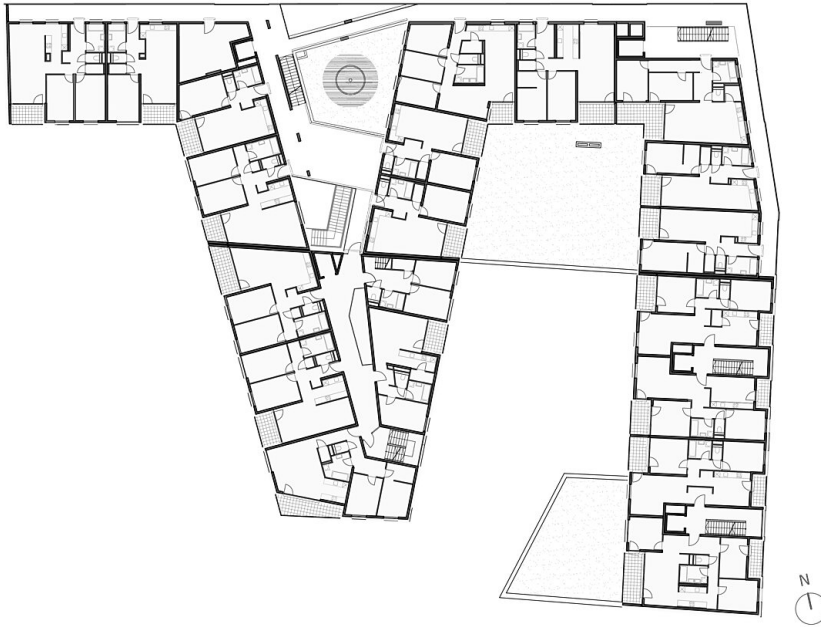
1st floor Grundriss OG1