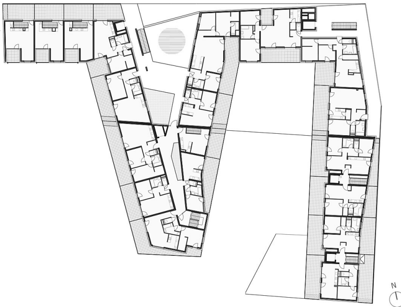
attic floor Grundriss DG