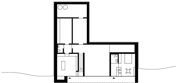
Grundriss UG 1:200