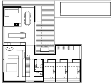
Grundriss EG 1:200