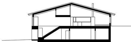
Schnitt 1 1:200