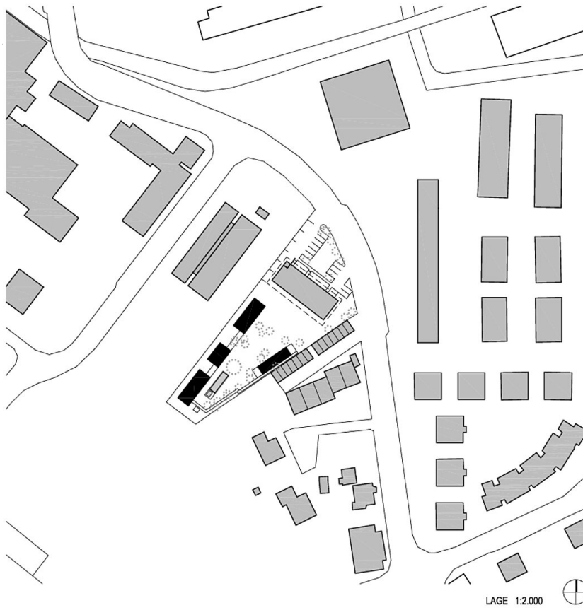
Gartenpavillons Wels Bauernstraße