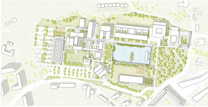
JKU Campus Linz – Freiraum