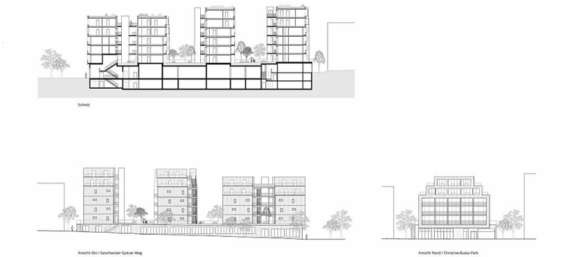
Tivoligasse, Ansichte / Schnitt