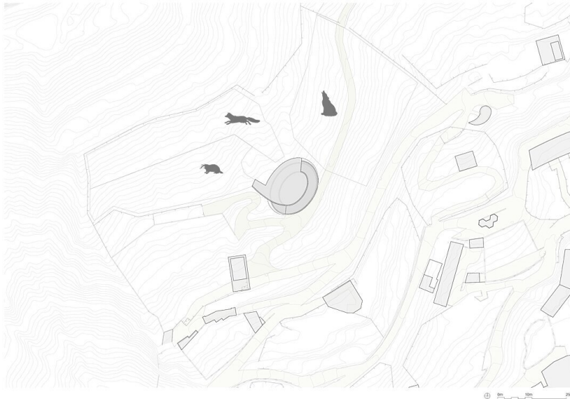
Fuchs- und Dachsanlage „Untertierisch“