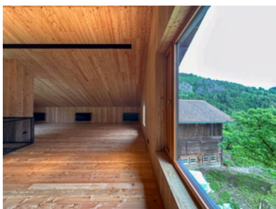
© Stadt : Labor – Architekten