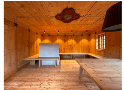
© Stadt : Labor – Architekten