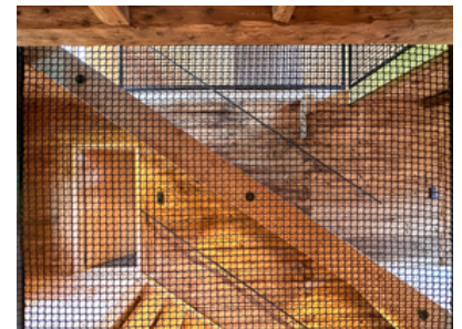
© Stadt : Labor – Architekten