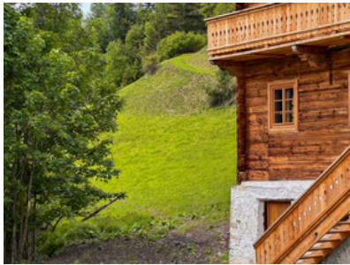
© Stadt : Labor – Architekten

Jurytext Auszeichnung des Landes Tirol für Neues Bauen 2024, aut. architektur und tirol, 15.11.2024