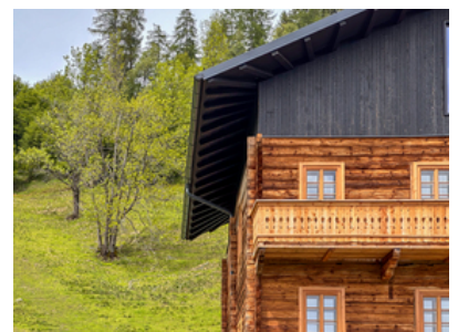
© Stadt : Labor – Architekten