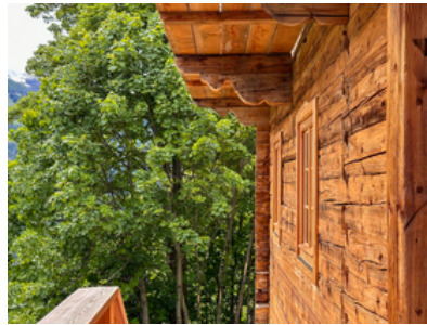
© Stadt : Labor – Architekten