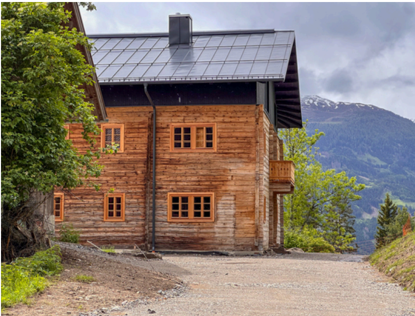
© Stadt : Labor – Architekten