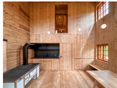
© Stadt : Labor – Architekten