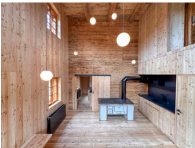
© Stadt : Labor – Architekten

Eine besondere architektonische Lösung wurde in der Küche realisiert, wo die ursprüngliche Decke nicht mehr vorhanden war. Diese wurde dazu genutzt, eine zweigeschossige Küche zu gestalten, die sich durch großzügige Raumhöhe und Helligkeit auszeichnet. Die historische Stube wurde mit viel Liebe zum Detail in ihren ursprünglichen Zustand zurückversetzt, wobei alte Holzelemente und traditionelle Handwerkskunst erhalten und sorgfältig aufgearbeitet wurden. Das Dachgeschoss des Bauernhofs wurde zu einem großen, stützenfreien Raum umgebaut, der vielfältige Nutzungsmöglichkeiten bietet, von einem Atelier über einen Wohnbereich bis hin zu einem Gemeinschaftsraum. (Text: Architekt:innen, bearbeitet)