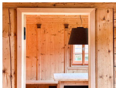
© Stadt : Labor – Architekten