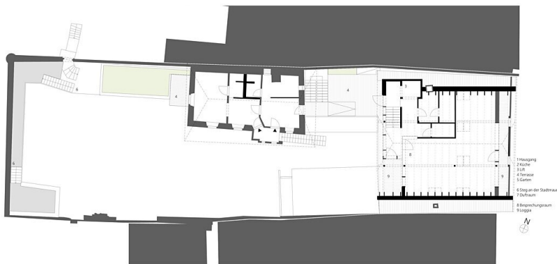
Sonnentor OG HP