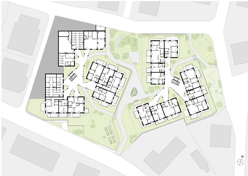
Grundriss EG Gesamt