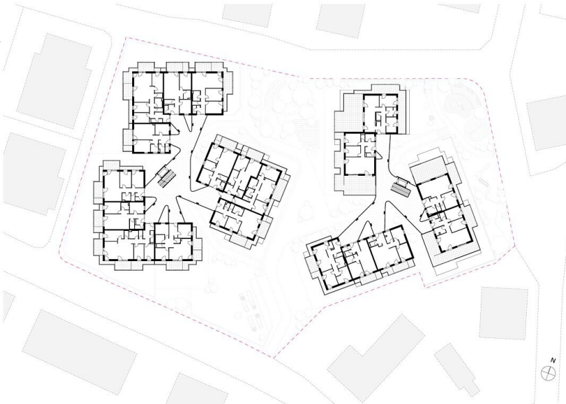
Grundriss OG Gesamt