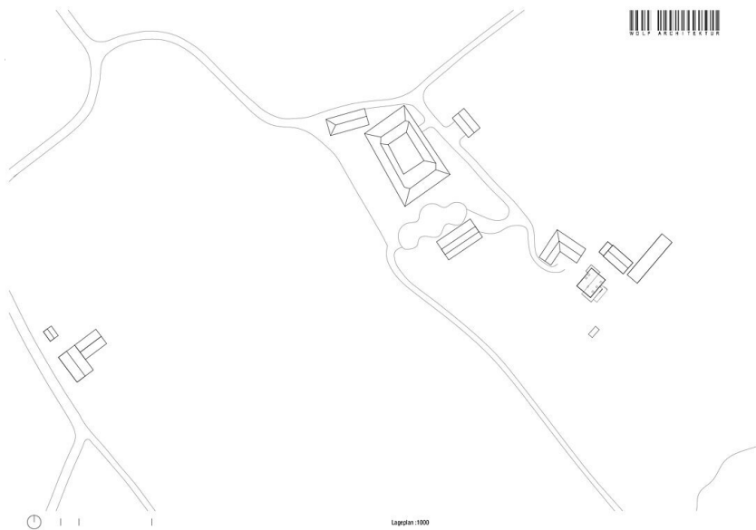
Haus beim Gehöft