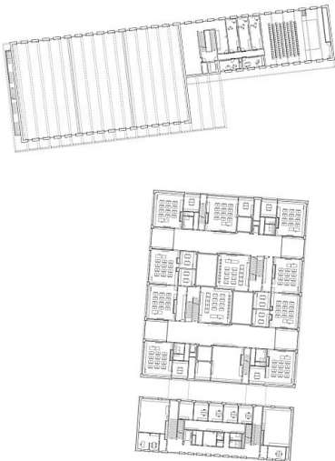
Grundriss 1. Obergeschoss, SSW Schulanlage Reitmen, Schlieren 1:500