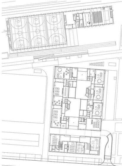
Grundriss Erdgeschoss, SSW Schulanlage Reitmen, Schlieren 1:500