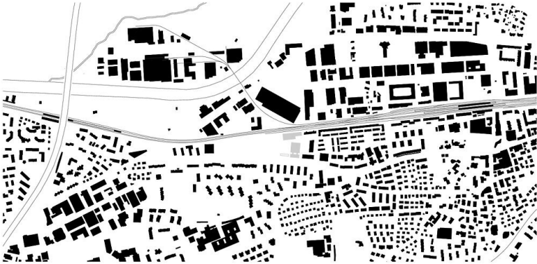
Schwarzplan, SSW Schulanlage Reitmen, Schlieren 1:10000