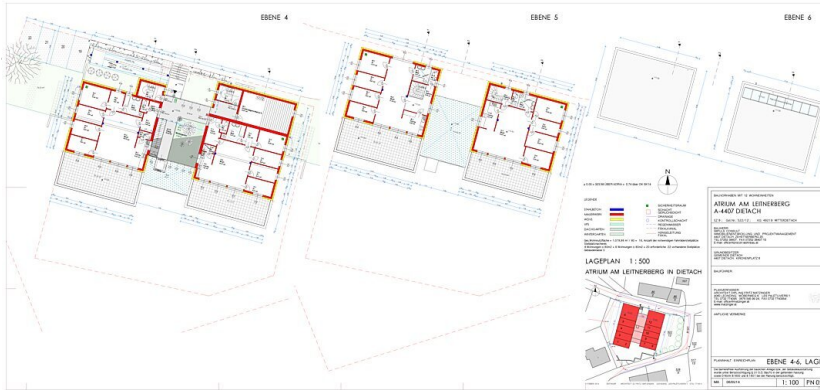
Grundrisse E4, E5, E6, Lageplan