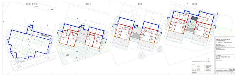
Atrium am Leitnerberg