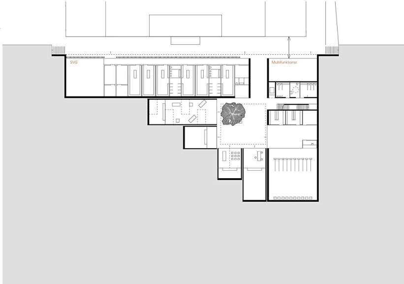
Grundriss Ebene Fußballplatz