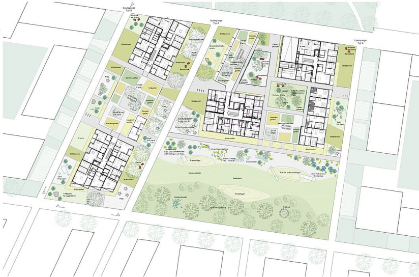
Freiraumplan Inkl. Dachgärten